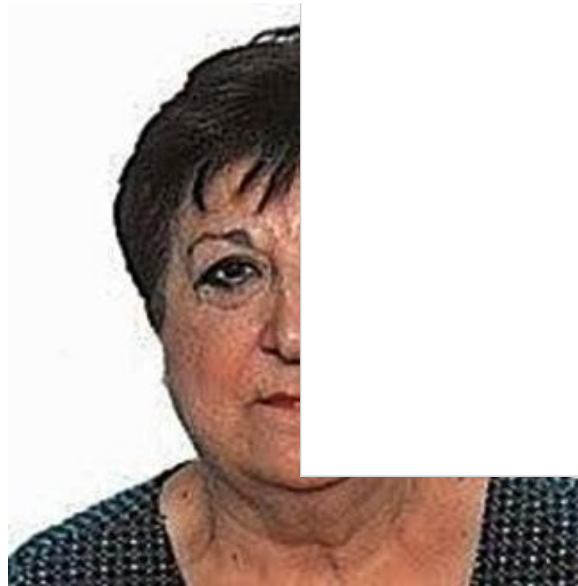
Mujeres socialistas de Zamora

En esta conmemoración del Día Internacional de la Mujer he preferido escribir para recordar a mujeres socialistas. A mujeres que dieron todo dentro del PSOE de Zamora, mi partido, para defender los valores y los derechos de las mujeres. Mujeres socialistas que ya no están pero que siguen en nuestra memoria. Y sobre todo en nuestro corazón.